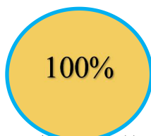
图 1：收入决算结构饼状图

本部门 2017 年度本年收入合计 27.25 万元，其中：财政拨款收入 27.25 万元，占 100%。如图 1 所示：