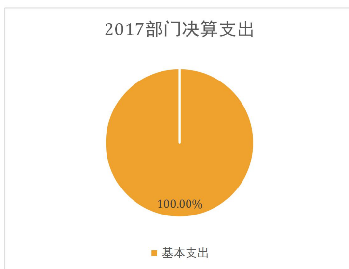
图 2：支出决算结构饼状图

本部门 2017 年度本年支出合计 44.882441 万元，其中：基本支出 44.882441 万元，占 100%。如图所示：