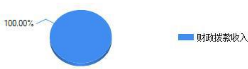
图 1：收入决算结构饼状图

本部门 2017 年度本年收入合计 912.11 万元，其中：财政拨款收入 912.11 万元，占 100%；事业收入 0 万元，占 0%；经营收入 0 万元，占 0%；其他收入 0 万元，占 0%。如图所示：