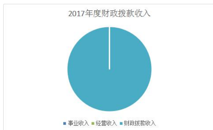
图 1：收入决算结构饼状图

2017 年部门决算收入 960.75 万元，其中：财政拨款收入 960.75 万元；上级补助收入 0 万元；事业收入 0 万元；其他收入 0 万元。如图所示：