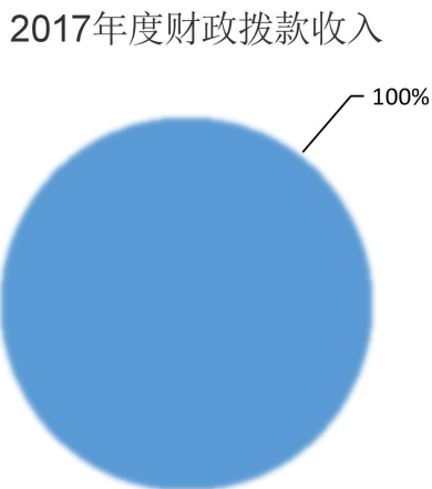
图 1：收入决算结构饼状图

2017 年度本年收入合计 225.36 万元，其中：财政拨款收入 225.36 万元，占 100%；事业收入 0 万元，占 0%；经营收入 0 万元，占 0%；其他收入 0 万元，占 0%。如图所示：