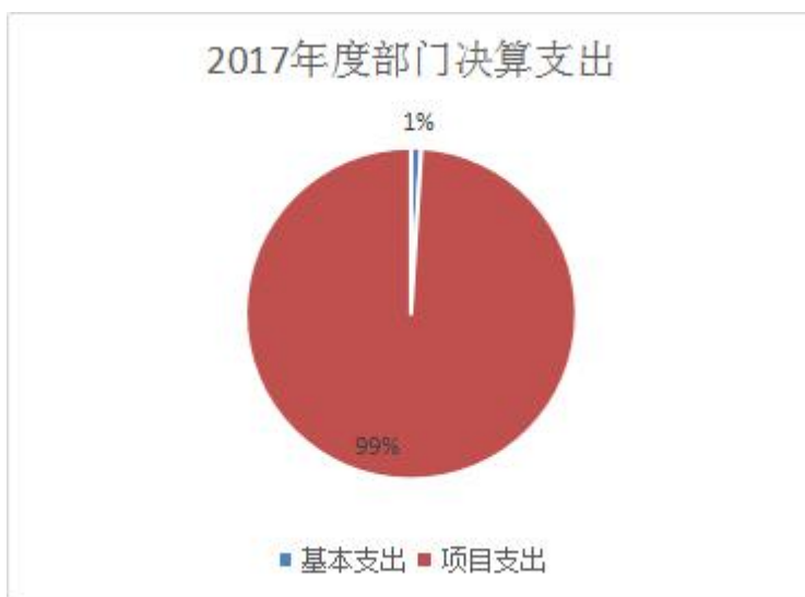
图 2：支出决算结构饼状图

本部门 2017 年度本年支出合计 9765.99 万元，其中：基本支出 97.02 万元，占 1%；项目支出 9668.97 万元，占 99%；经营支出 0 万元，占 0%。如图所示：