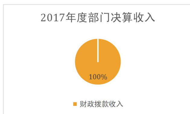
图 1：收入决算结构饼状图

本部门 2017 年度本年收入合计 1075 万元，其中：财政拨款收入 1075 万元，占 100%；事业收入 0 万元，占 0%；经营收入 0 万元，占 0%；其他收入 0 万元，占 0%。如图所示：