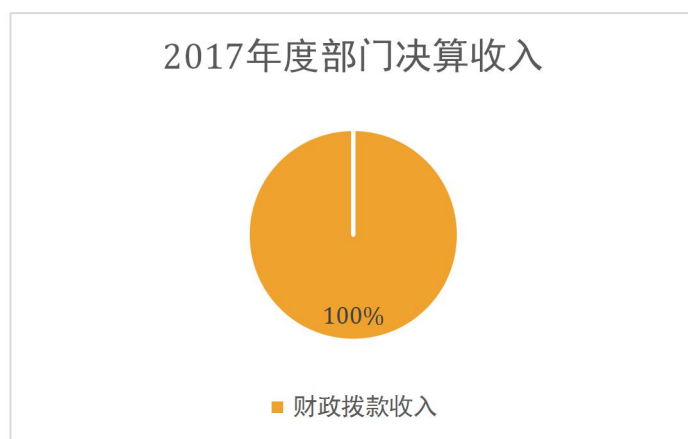
图 1：收入决算结构饼状图

本部门 2017 年度本年收入合计 1950 万元，其中：财政拨款收入 1950 万元，占 100%；事业收入 0 万元，占 0%；经营收入 0 万元，占 0%；其他收入 0 万元，占 0%。如图所示：