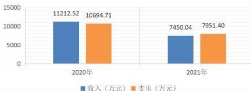
财政拨款收支对比图 (图3)

3. 国有资本经营预算财政拨款本年收入 0 万元,与 2020 年度决算收入持平,主要原因是无国有资本经营预算财政拨款收入;本年支出 0 万元,与 2020 年度决算支出持平,主要是无国有资本经营预算财政拨款支出。