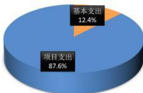
图2：支出决算构成情况（按支出性质）

本部门 2021 年度支出合计 7951.40 万元，其中：基本支出 988.03 万元，占 12.4%；项目支出 6963.37 万元，占 87.6%；经营支出 0 万元，占 0%。如图所示：